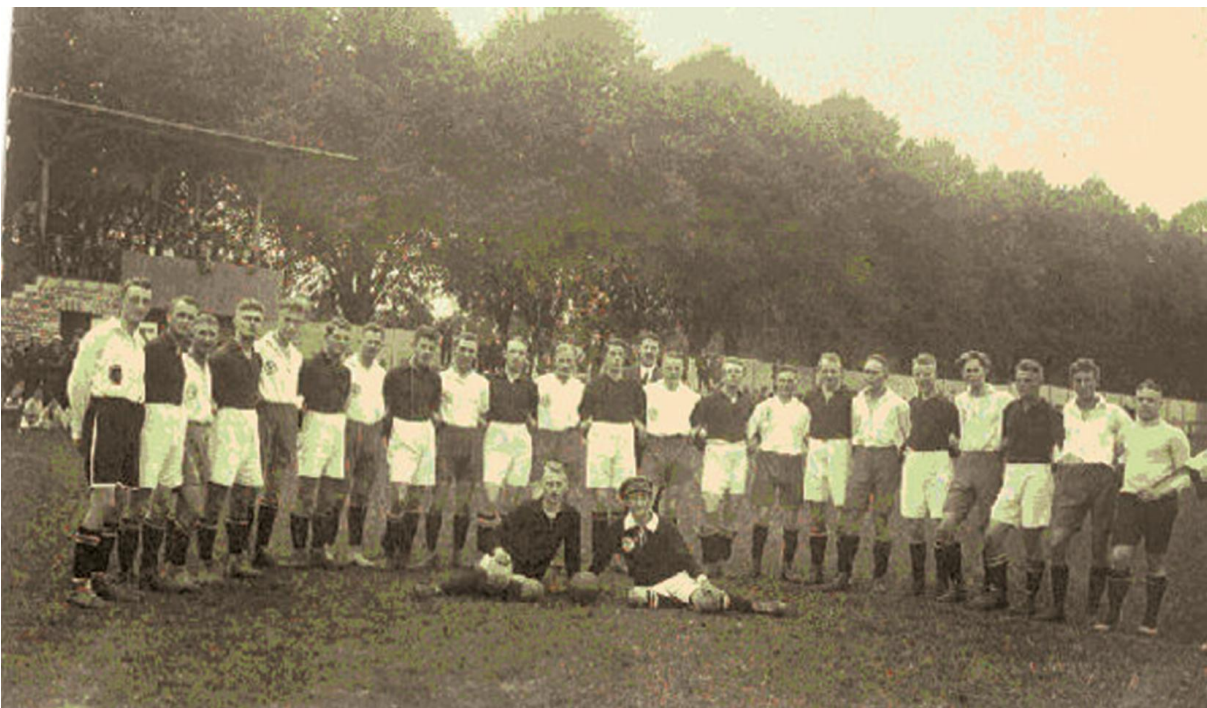
Einweihung des MTV-Platzes: Die Mannschaften des MTV und von Gut Heil Lübeck am 04.09.1921